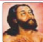
Devasahayam Pillai (1712-1752)