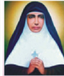
Blessed Mother Mariam Thesia (1876 - 1926)