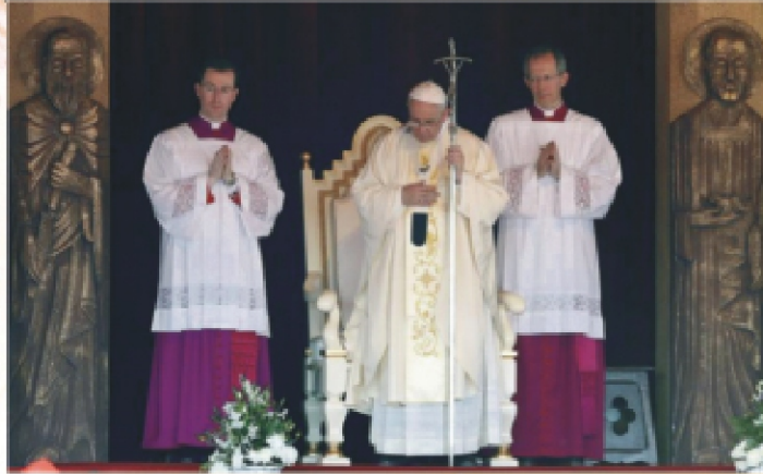
Pope Francis blesses the altar during a Mass in Colombo, Sri Lanka, Wednesday, Jan. 14, 2015. He canonized the country's first saint, Joseph Vaz, during the Mass.

Pope Francis spread a message of unity between Sri Lanka's Sinhalese ethnic majority and Tamil minority by canonizing Joseph Vaz, the country's first saint, and visiting a church revered by Catholics from both groups on Wednesday. Francis used the second day of his six-day tour of Asia to declare Vaz a model of faith for his equal ministering to all people regardless of ethnicity.